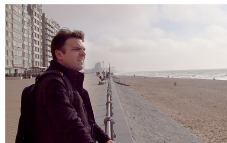
Im belgischen Ostende