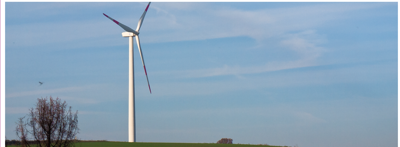
Windkraftanlage in Velbert

„Hundertprozentig erneuerbar - Gemeinsam die Bergische Energiewende gestalten“ lautet das Motto der Bergischen Erklärung, welche von Volker Münchow (SPD), Jutta Velte (Die Grünen) und weiteren