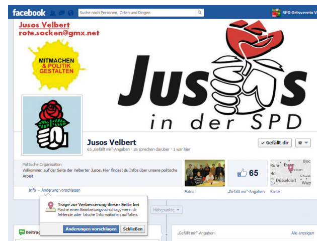
Die Jusos bei Facebook: facebook.com/JusosVelbert